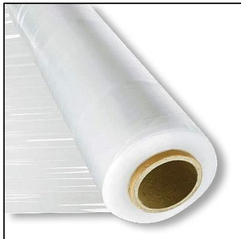
FILM ESTENSIBILE LDPE4 PLASTICA