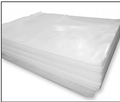
FOGLI COPRIPALLET PP4 PLASTICA